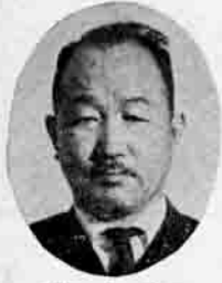
手賀寧議員 片野業 農