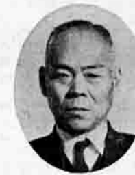
鈴木重美議員 瓦谷業 農