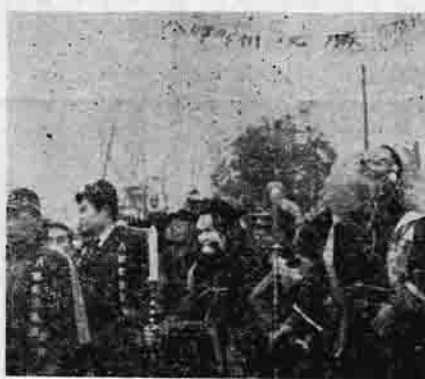
郡代表で入場する選手たち