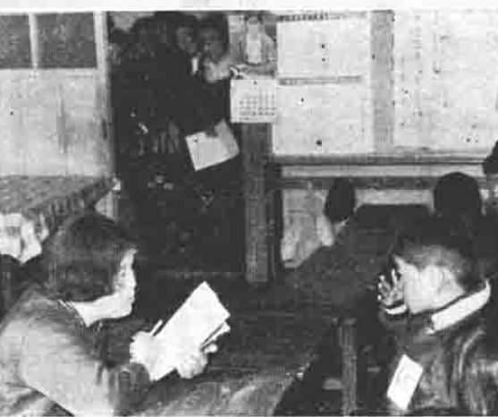
「おめめはどれ、」 父兄の見守るなかで 新入生の知能テスト 一 小幡小学校で

まからお認めいただけるよう力を尽す所存です。また、今年からは、「明るく住みよい農村としての八郷町」の建設を目指して、田園都市建設の事業を、役場の機能をあげてこれを推進することになっておりますので、この町長の方針をたいし、農業従事者や他産