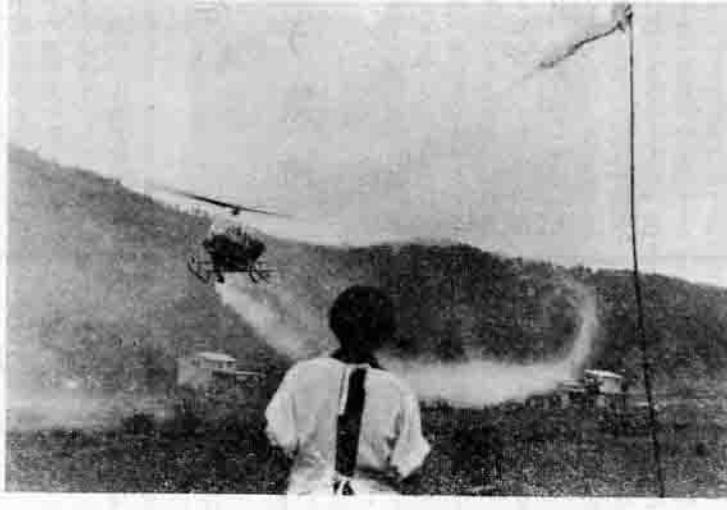
防除に活躍するヘリコプター =吉生地内で=

小、中学校あわせて一七校の完全給食をめざして給食センターを建設することになってきたが、敷地も決定、年度内完成をめざして、八月下旬ごろから着手することになった。 建設の目的は、まだ実施していない四つの中学校の完全給食と一三校ある小学校の老朽化した給食設備の改善とを目的としています。 このセンターには、一度に一、〇〇〇人分のおかずを煮ることができ、釜（ライスポイラー）六基がそろえられ、野菜などはサイノ目切機、合成調理機、連続野菜切機などにより機械で切られます。また、食器は食器洗浄機で洗い、天ぷらなどをあげるオートフライヤーなどもそなえつけられます。 調理されたおかずは、食缶や食器などいっしょに三台の配送車で、各学校に配ばられ、暖かい給食をとることができるようにします。