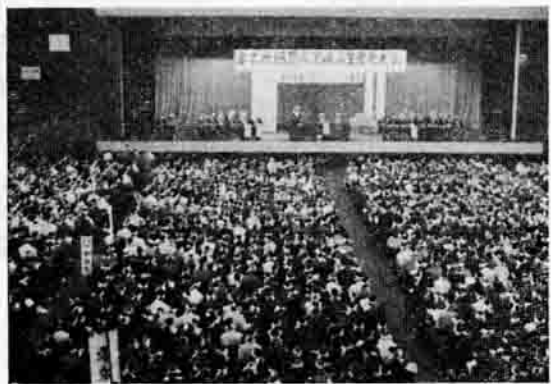
表者ら五二名が参加し、要求貫徹に次の四項目の決議を採択した。

田植も終り、今年の米価シーズンが開幕しました。今年の農業団体の統一要求米価は、一俵六〇、〇〇〇当り九千二百四十四円と決定し、この獲得をめざす「要求米価貫徹茨城県生産者大会」が六月十九日午前十時から水戸市の県立スポーツセンターに四、五〇〇名の