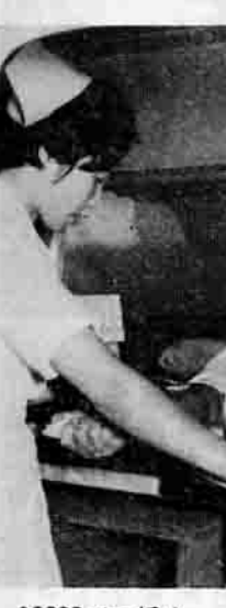
200CCづつ採血 =八郷公民館で=

も持っています。日本全土からの歴史資料を展示してある上野博物館同様、その所在を明示して柿岡考古博物館と命名した