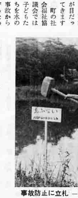
事故防止に立札—前島の池—

フレットの配布、広報車の活動、棄権防止のポスター掲示などを行ないました。開票は、午後七時半から役場議場で行ない、地方区を先にし、全国区を後にして行ないました。終了したのは午後十一時(一部は午前三時まで)でした。