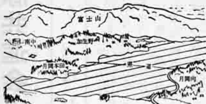
略図で、斜線の部分が整備される