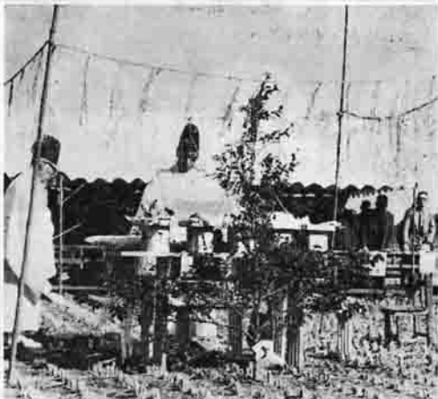
工事の安全を願ひ地鎮祭

この事業は、小桜川流域の大字青田、弓弦、月岡、川又、加生野に及ぶ水田六七・八ヘクタールを総工事費八千四百五十七万円で区画整理しようとするもの。同時に、農道、用排水路、揚水施設などを整備し、乾田化し、土地の利用度を高め、労力の節減をも図ろうとしています。