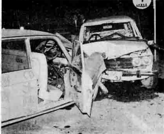
こんな事故が いつ起こるかわかりません