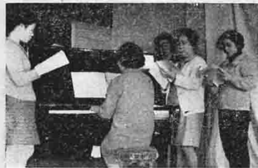
ピアノで歌を習う婦人学級生

小、中学校のピアノを借りて練習をするというような状態が、非常に不便でした。そこで、婦人会員の強い要望となり、婦人会が独自で購入するよう計画もたてましたが、高額なためなかなか購入する目安がつかいません。こうした熱意に町が