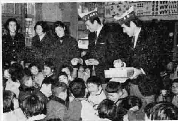
児童にプレゼントするクラブ員 一 柿岡保育所で

奉仕活動をつづける八郷ライオンズクラブ(代表枝弘三氏)では、三月三日の「ひなまつり」に、町内七つの保育所と幼稚園を訪問、アイスクリームのプレゼントをしました。このような奉仕活動の計画です。