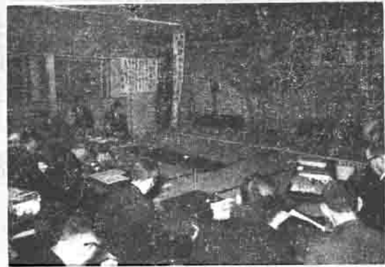
八郷町統計大会(写真)が、三月四日老人福祉センターで開かれ、統計功労者

の表彰を行ないました。大会の席上、町長は永年勤続者の表彰と退職者に感謝状を贈りました。また、県統計協会総裁賞の表彰伝達もありました。