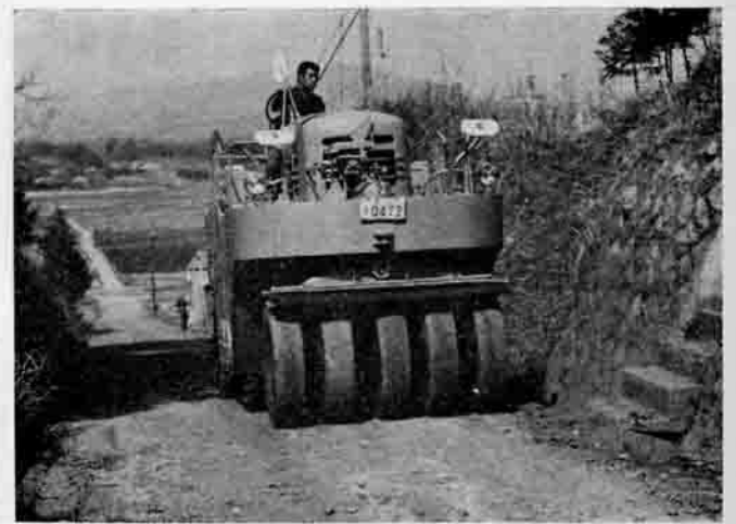
道路の舗装つづく 一柿岡下宿地内一

悪条件のもとで、役場で把握しました資料によりまして、農家一戸あたりの所得も四十三年度の五十三万円を越えて、五十六万円とわずかでありすが伸びております。しかしながら、農業と他産業との所得の格差にはなおきびしいものがありまして、兼業農家が日を