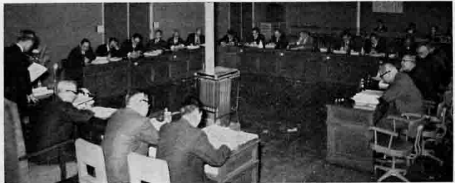
定例議会で施政方針をのべる町長

今年第一回の定例議会が三月十日から一四日間の会期で開かれましたが、この議会で、昭和四十五年度の一般会計と五つの特別会計予算が可決されました。この定例議会には一般会計予算案など二つの追加議案を含む一五の議案が上程