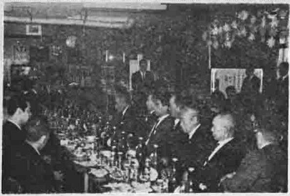
立派に舗装された「湯袋観光道路」のしゅん工式(写真)が、3月30日風返峠で盛大に行なわれました。この日は、県、営林署、地元関係者、業者、土地提供者らを招いて行ない、席上、3名の業者、18名の土地提供者に記念品をそえて感謝状を贈り協力へのお礼としました。

課技術職員、観光係が増員されます。 ▽特別職で非常勤職員の報酬などの引き上げ... ▽固定資産評価審査委員会委員の選任 ▽一般会計補正予算... 千七百八十万六千円が補正されました。 ▽有線放送の補正予算... 五十万円が補正されました。 ▽旧軍人の一時恩給に関する意見書の可決 ▽四十五年固定資産税の納期の変更