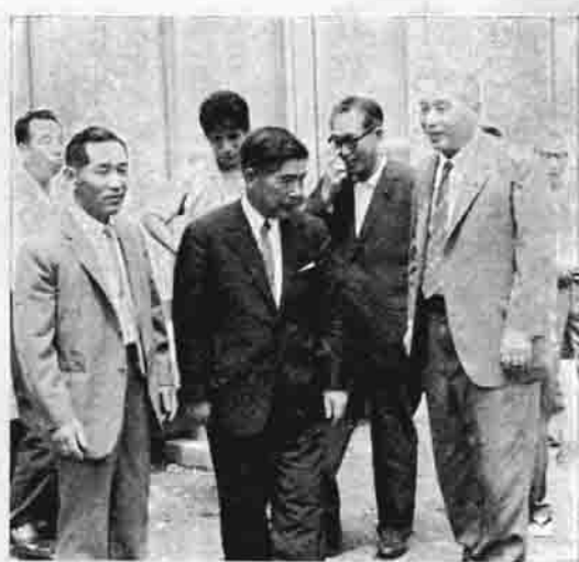
委員長とともにセンターの説明をする町長

話し合いのもとに行ない、積極的に地元民の声をとり入れる方針です。 休養村指定の条件には、自然の保護や宿泊施設の充