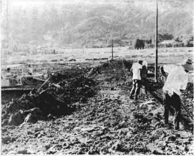
整地がはじめられた吉生土地改良区

「ゴー」という力強い音を立てて整地を進めるブルドーザー、そして、そこに働く農民の姿からは、明日の農業をつくる意気込みが感じられます。 工業の発達にとまらぬ、農業の立ち遅れが目立ってきています。町でもこの対策には力を入れており、農業の近代化をはかるために数々の事業を行なっています。その中にあるのが土地改良事業です。多額の費用を投じて農地を完全に整地し、あわせて農道の整備を行ない農業の機械化をはかるというこの事業は、費用の面や共同経営についてのいろいろな問題がありますがそのひとつひとつを克服しながら工事は進められています。 昨年からの工事が行なわれている川又、両折の両土地改良区は、二年目をむかえてさらに整地面積を拡大しこれとあわせて農道の整備揚排水路の整備をはかりました。また、今年度のあたり