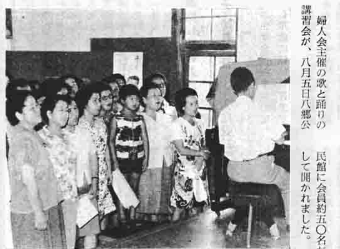
ピアノにあわせて歌の練習をする会員たち