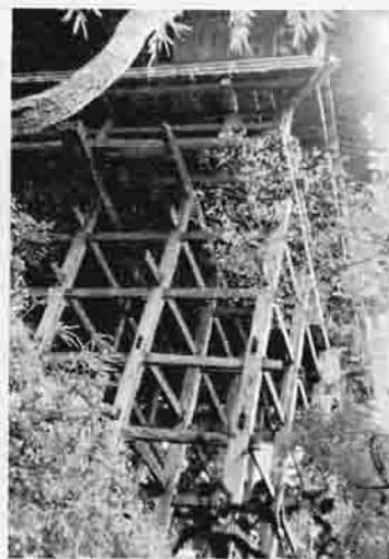
保存修理が決まった西光院

た研修生たちは、農業に取り組みきびしさと将来の希望をつかみとり、新たな覚悟で農業に取り組む意志をかためたようでした。また今回の研修で町村長や各関係者の献身的なごまなしを受け、研修生にとって大きな成果となったようです。現在研修生がレポートを作成中であり、町でもこれらのレポートを中心に「研修のまとめ」を作成し、研修に参加できなかった若い人たちにも研修の報告をすすめる予定です。