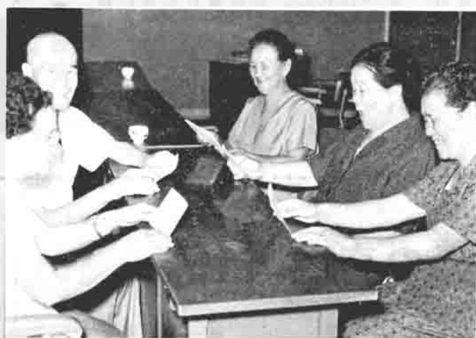
証書を見てよろこぶお年寄り 一役場議場一

才から六五才までの人たちで、自分で一〇年間保険料を納めて受給できたので、十年年金にはいつていたことと、長生きしてきたことをたいへん喜んでいました。今回の受給者は三二名で