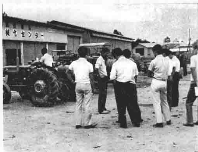
研修センターで研修する研修生