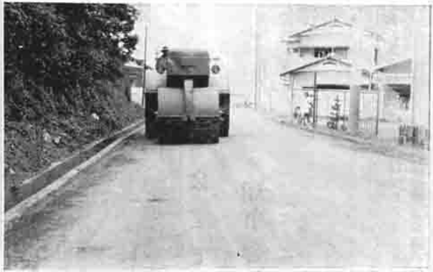
町道の舗装すすむ 一柿岡下宿地内一

よる町独自の政策がきめてまわく実施されており、研修生たちはたいへん勉強になったようです。また、糸賀町は総面積二七三平方キロメートル。その三分の二以上が山間地帯でこの山間にあつづく台地は、糸賀中部総合開発事業という大きな