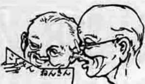
花ひらく国民年金 (8)

年金証書の伝達式は、七月十六日役場議場に受給者を招いて行なわれ、開会のあと、町長がひとりひとり証書を手渡ししました。また町長は、これからもじよ