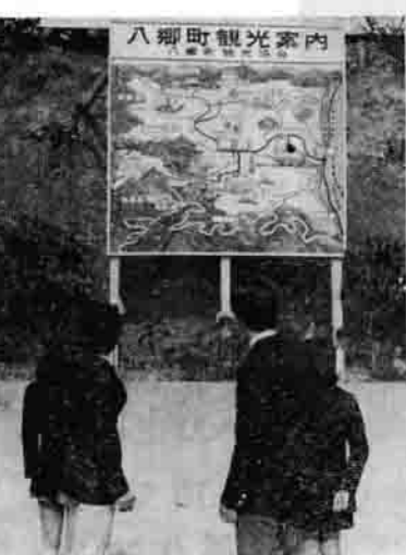
カラー塗りの大きな観光案内板

町の観光協会では、町をおとす観光客に名所、旧跡などをひと目で知ってもらおうと、このほどカラ