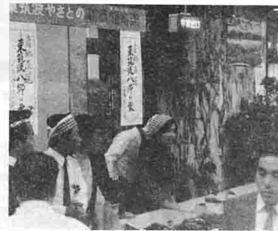
八郷の栗、を売る商工会青年部員

も絶好の場所となっているからです。商工会青年部では、今後このような催しをしたいと考えており、今回のことが八郷町のPRにたいへん役に立ったものと思われま