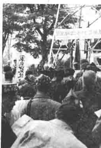
美幸ヶ原で行なわれた美化大会

「花とほろぎの県民運動」の一環として、清潔な環境づくり、公衆道徳の高揚を合意した八郷町、筑波町、真壁町、果新生活運動推進協議会が主催で、さる十月十七日「筑波山を美しくする県民大会」が筑波山の御幸ヶ原で開かれました。