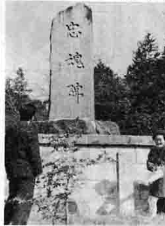
八坂神社から高友山に移された忠魂碑