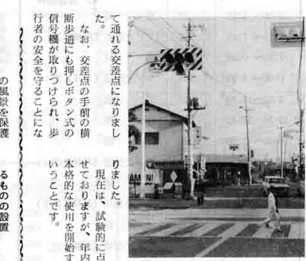
安心して渡れる横断歩道に