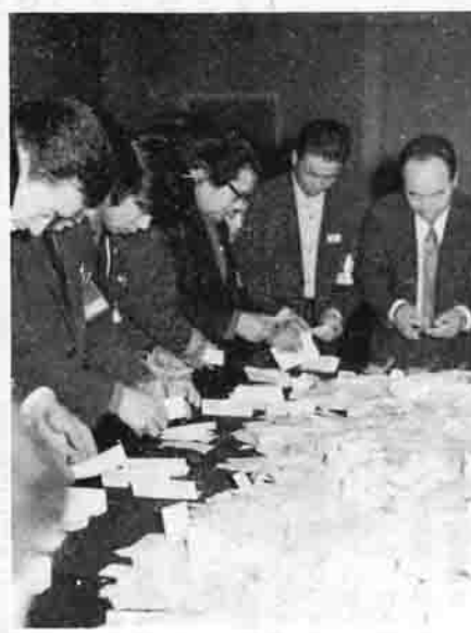
役場議場で行なわれた開票

参院地方区選出議員の補欠選挙が二月六日に行なわれましたが、町では二六の投票区で投票が行なわれ、午後七時三十分から役場議場で、即日開票が行なわれました。