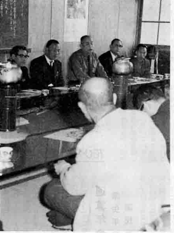
町長をかこんでの移動役場 — 芦穂地区公民館 —

問「ゴミ捨て場のパイプで木が枯れてしまう。また道路わきにゴミがたかき、捨ててあるが処置はどうするか」 答「管理人がいらないため迷惑をかけている。広域市町村圏の設定で、町、出島、新治、千代田の四カ町村で共同のゴミ処理施設を四十七年度着工の予定であり、これによって解決できると思う」