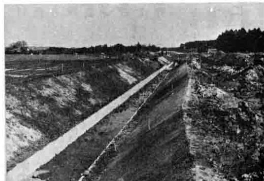
1区画30aの大きなほ場に生まれかわる上根地区

江垂地区は、昭和四十七年度より三工区、三年度にわたって行ってきました。今年度はその最終年度となり、予定面積はすべて完了することになります。当地区は、は場整備事