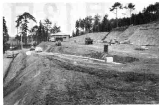
直売所もでき工事が急ピッチで進むフラワーセンター

（総アルミ、ガラス温室）を配し、花木などを年間一〇万本生産する能力を持っています。また、駐車場（約一千平方メートル）、農林水産物直売所、休憩所、便所等も設置され、観光園地として理想的なセンターとなっています。