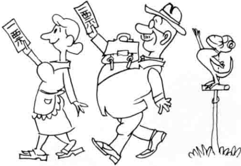
この一票澄んだ心で胸はつて