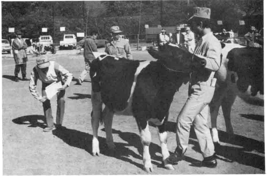
△審査員も真剣（畜産共進会）