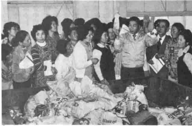
広域ゴミ処理施設で説明を受ける一コマ

この見学会 集を行ったところ、一三〇名が、婦人学級、集まり、バスを増車して実施する。生活学校、とこの盛況ぶり、当町婦人学級生・婦人の学習意欲のあらわれと関係者をよるこぼせました。