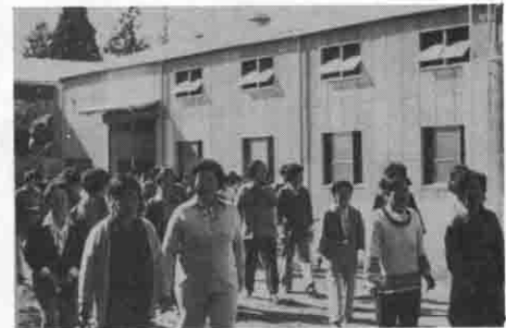
養豚し尿処理施設の見学

一〇〇名の募 好天に恵まれた当日朝公民館を出発し、最初は鯨岡にある町独自で行っている「養豚し尿処理施設」を見学、豚プンが袋詰の肥料に製品化されるまでの大きな機械に目をみはりました。その後、千代田村につくられた「新治地方じん荼焼却場」へバスをすすめ、家庭から出されたゴミの山と再会、焼かれたいり圧縮されたりする過程を所長の案内で見学しました。焼却場と隣接している「新治地方老人福祉センター」で余