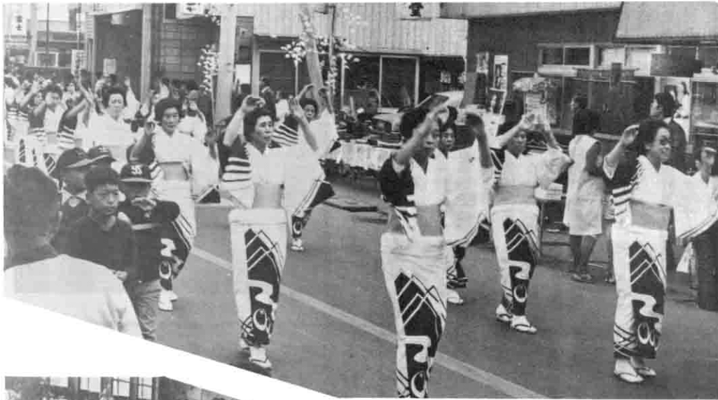
▽ 婦人会の人たちによって行われた八郷音頭の発表会 (柿岡商店街で)