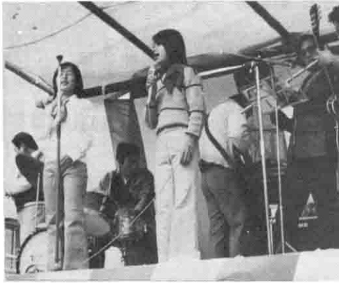
△美声を披露（素人のど自慢大会）