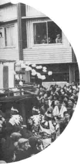
◁にぎわう中をからくり人形も繰り出される