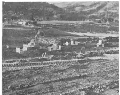
労働の省力化のためほ場整備が進む (太田地区で)

林産物の生産の確保のため、林道の開設(弓弦線五〇〇メートル、真家線七四〇メートル、中戸線二、四〇〇メートル、十三塚線二、〇〇〇メートル、大増線一、〇〇〇メートル、鳴滝不動尊線一、二〇〇メートル、上曾線一、〇〇〇メートル、青田中山線五〇〇メートル、菖蒲沢線五〇〇メートル)を幅員四メートルで行うほか、既設林道の機能向上のため、改良工事六、〇〇〇メートルを行います。また、舗装工事にも着手します。