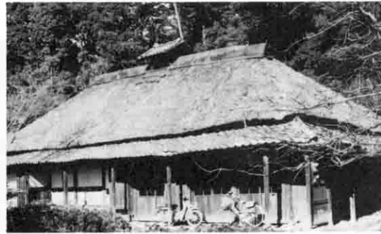
重要文化財 羽生家住宅 指定年月日 昭和五十一年二月三日

土間の下手二間半余りは、18世紀中頃に拡張されたと考えられるなど全体がかなり改造されているが、この住宅は、茨城県下では最古に属する遺例の一つとして貴重である。