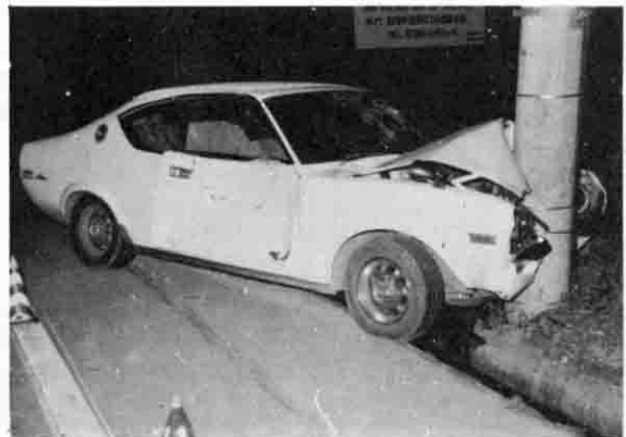
県内で起きた飲酒運転による事故

子どもの交通事故の発生しやすい時間は、下校時あるいは下校後の一〜二時間の間に最も多く発生しています。特に、午後四時から六時までの時間が要注意です。 なお、曜日別では、土・日曜日の発生が目立っています。 行動半径のせまい子どもの事故は、自宅近くが最も多く、特に半径五〇メートル以内が危険地帯であり、低年齢になればなるほど多くなっています。