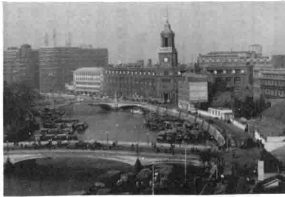
上海の街のようす

職時賃金の七割が支給され、ほとんどの女性が働きに出ているとか。上海ばかりでなく、中国の至る