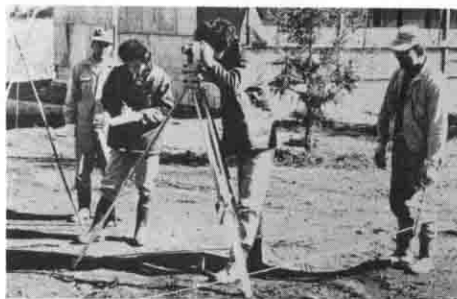
地籍調査の測量が進められている(金指地区で)

「緑にとけ込んだ健康で明るい調和のとれた豊かな町づくり」をめざした町総合計画の、昭和五十三年度から三ヶ年間の主要事業などを盛り込んだ実施計画が、町総合計画審議会の諮問を経て、一月にでき上がりました。この計画は、施策の実行性を高めるため財政的な裏付けを伴う計画であり、経済や社会的な動向をふまえより現実性のあるものとするために、毎年度所要の修正・補完を行い改定していくローリング方式を採用しています。