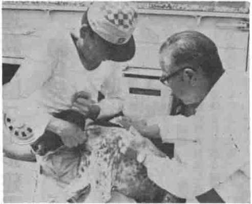
狂犬病予防注射の一コマ

◎登録と予防注射を必ず受ける 生後三ヶ月以上の犬を飼っている方は、年に一回の畜犬登録と、年二回の狂犬病予防注射を