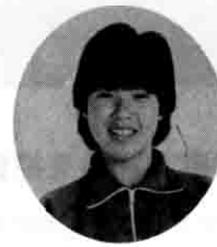
「おはよう」で仲直り

ばもなく、うつむいて何度も何度も謝りました。しかし、Aさんはそれ以来、口をきいてくれませんでした。私たちは、苦い思い出を抱いて、一日一日を過ごしていました。