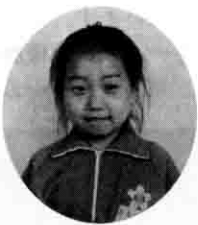
「おはよう」はまほうのことば

それだけではありません。「おはよう」っていうことばは、ここをこめてがんばっていえば、ここをあなたたかくしてくれまます。みんなげんきに「おはよう」をいえば、みんながあなたたかいところにるとおもいます。「おはよう」だけでなく「ありがどう」や「しつれいします」「すみません」もきつとまほうのことばだとも思います。たくさんいえるようにしたいです。