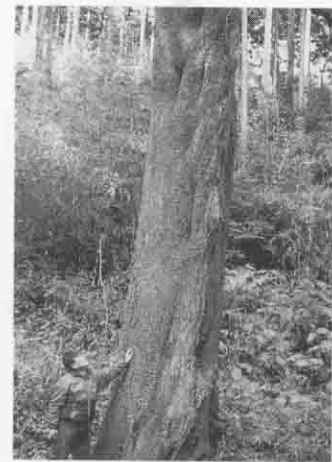
この樹は、桜にしては珍

しく、主幹が真っ直ぐに10mほどに 伸び、周りの杉の梢より高く枝を張 り出し、丸く覆い繁っています。