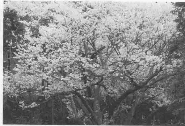
ヤマザクラ《バラ科・サクラ属》

名地者周高反と竹林一反の壳 種在理高樹所管胸樹 ヤマザクラ 354 上木 3.7m 青柳 24.7m 真氏