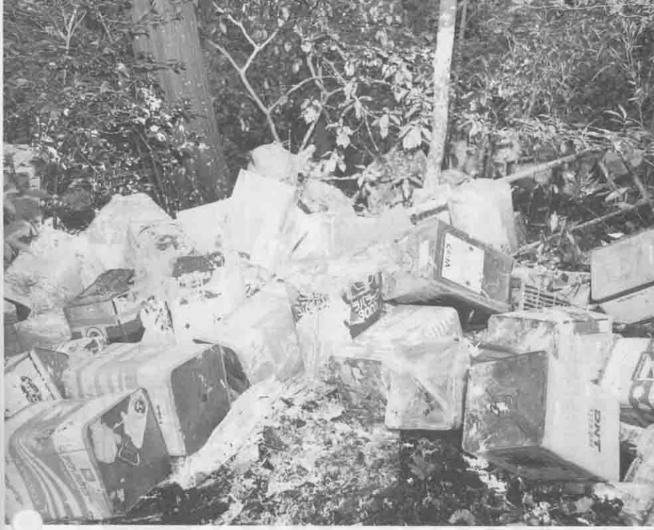
このような不法投棄が後を立ちません。八郷町でも昨年度は18件の不法投棄の通報が……。このような自然環境の破壊は法でも罰せられます。

美しい環境を守るためには、わたしたち一人ひとりがライフスタイルを見直し、環境問題について考えなければなりません。