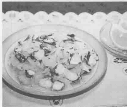
たこの青じそ バター炒め