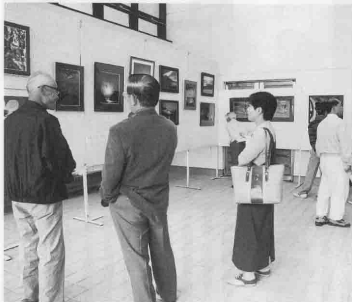
会場には269点の作品が展示され、期間中は多くの人たちが訪れました。

第三回八郷町美術展が五月十四日から十八日までの五日間、中央公民館を会場に開催されました。美術展は、美術を通して町の文化活動をさらに発展させ、住民の皆さんが互いに交流する“ことを目的として町美術展実行委員会が主催、町芸術祭運営委員会、町文化協会、町教育委員会の後援により行われているものです。ことしは、十六歳の高校生から九十一歳までの方が二百三名がきました。 出品、日本画・水墨画、洋画、彫刻・工芸、書、写真それぞれの部門合わせて二百六十九点が展示されました。 会場には五日間で延べ千人が訪れ、それぞれ展示されている作品に足を止め、見入っていました。出品者も昨年から比べると、ことしは三十四人も増え、八郷町美術展が町全体に広まり、定着してきたことをうかがい知ることができました。