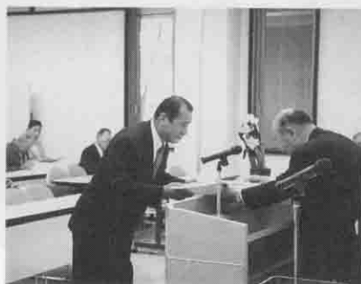
2年以上勤続の退職区長に感謝状贈呈