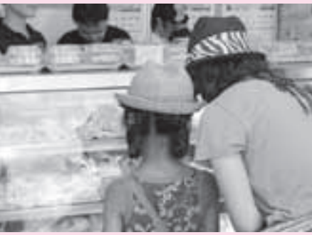
▲販売開始イベント(まちかど情報センター)