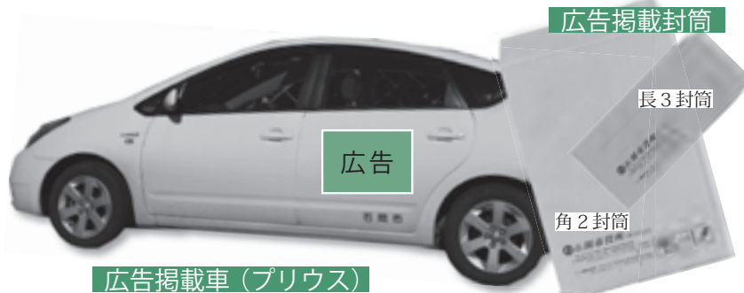
広告掲載車(プリウス)

市では、自主財源の確保を目的に、市が使用する封筒と公用車に掲載する広告を募集します。