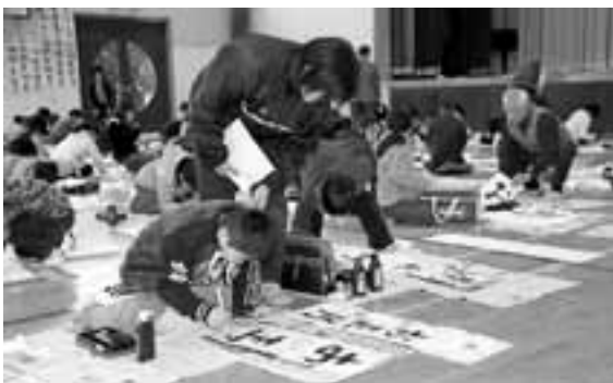
▲書き初めをする児童と指導する会員（柿小体育館）

会員たちは、児童の間を回ってアドバイスをしたり、時には手を取るなど熱心に指導しました。一生懸命書き上げた作品は、体育館の壁に展示されました。