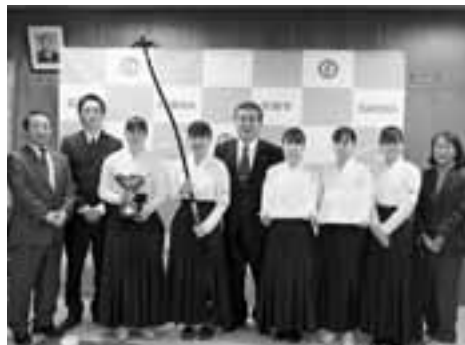
▲表敬訪問した石岡商高女子弓道部員

に鹿児島市で行われる全国選抜大会出場を報告しました。 同部は、昨年11月10日に県武道館で行われた県の高校新人大会の団体の部で、4年ぶりに優勝を果たし、全国大会出場を決めました。 部員たちは、緊張した面持ちで市長に優勝を報告。その後、弓道のことなどを話しました。 部員たちの、全国大会での活躍が期待されます。