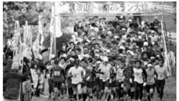
▲オートキャンプ場を出発するトレイルランの参加者

県から南は兵庫県まで、参加申し込みがありました。また、アメリカやドイツからの申し込みもあり、当日は200人が参加しました。また、100人ものボランティアスタッフが協力し、大会を盛り上げました。