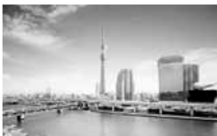
▲東京スカイツリー完成イメージ

2011年7月24日の地デジ完全移行に向けて、地デジに関する情報を連載しています。連載第11回目は「東京スカイツリー」について紹介します。【東京スカイツリー】