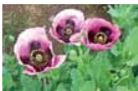
○土浦保健所管内で発見された、植えてはいけない「けし」の一例