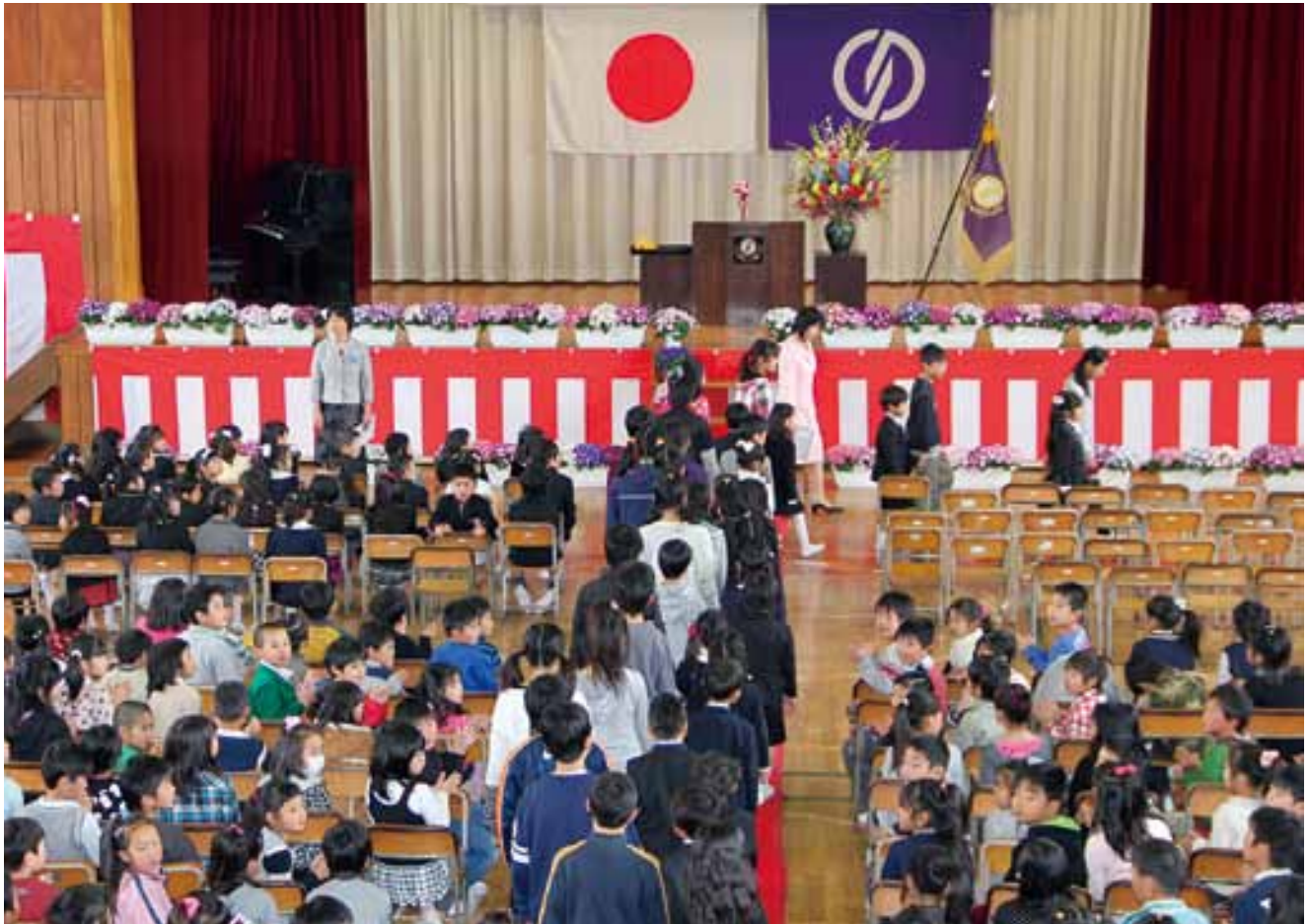
▲新入児童の入場（杉並小体育館）