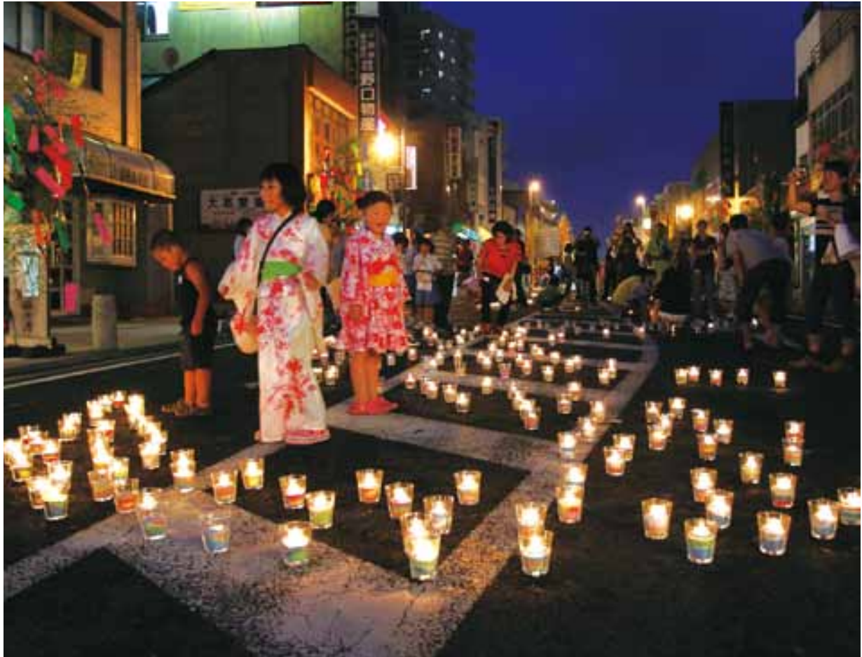
▲キャンドルで飾られた御幸通り