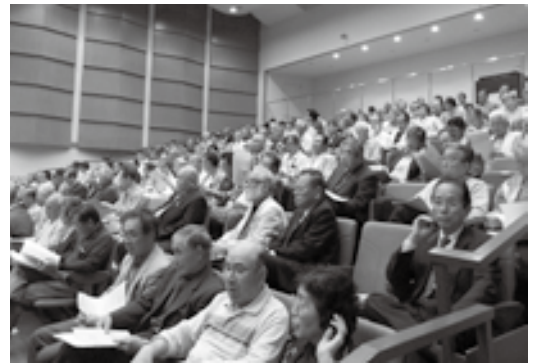
▲平成23年度総会(ふれあいの里石岡 ひまわりの館)

住みよいまち」の建設のためには、まだまだ市全体で力を合わせて行かなければならないことが沢山あると思います。その住みよいまちづくりの主役は私たち市民であることは言うまでもありません。今後、8万人の市民の皆さんと298地区の区長の方には、各種事業に対して積極的に参加していただきまして、「平和で豊かな石岡」づくりに一層のご協力をお願い申し上げます。ごあいさつといたします。