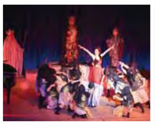
プロ歌手と市民の共演（閻魔庁の場面）