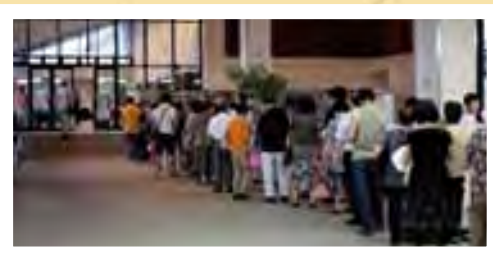
開演を待つ来場者