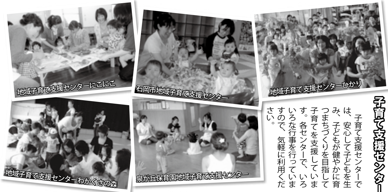
地域子育て支援センターにこここ

子育て支援センターでは、安心して子どもを生ま、子どもが健やかに育つまちづくりを目指して子育てを支援しています。各センターで、いろいろな行事を行っていただきますので、気軽に利用ください。