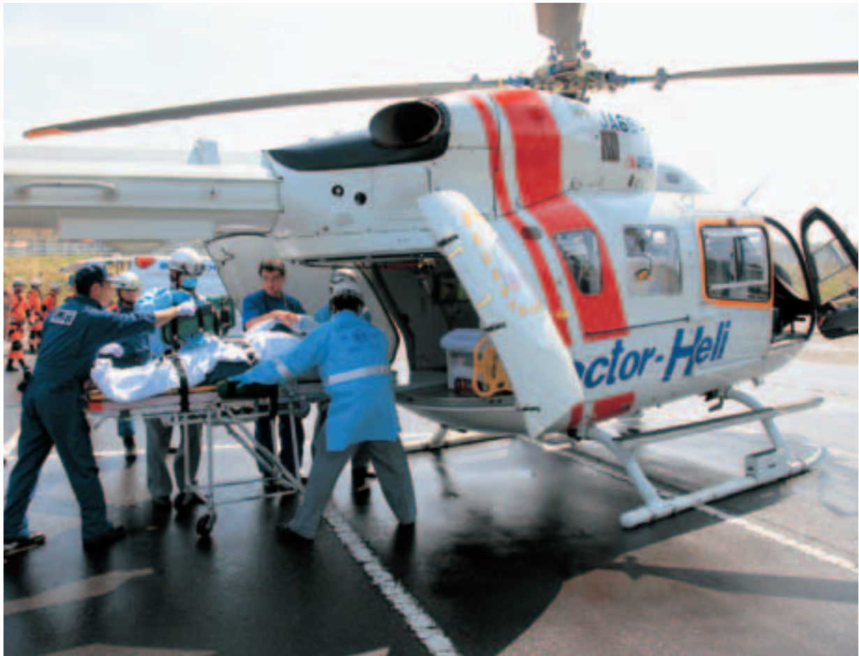
▲ドクターヘリ訓練（県畜産センター駐車場）