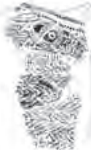
▲展示予定の縄文土器

ここ数年、道路建設や鉄塔建設など開発に伴い発掘調査が行われてきました。この度、その成果の一部を展示します。