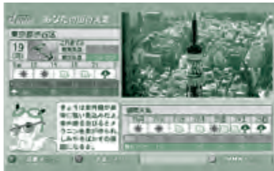
▲データ放送画面イメージ図