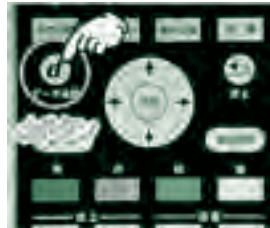
▲リモコンdボタンイメージ図

リモコンの「d」ボタンを押せば、データ放送画面が現れます。まだ試したことのない人は、ぜひ活用してみてください。