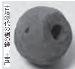
古墳時代の網の錘「土玉」

城を配置した結果であると思われます。近年の調査の結果、同地区の歴史の深さが分かってきました。