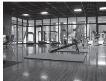
■ヘルストレーニング室 各種トレーニング機器があり、ストレスの発散や目的にあった運動が楽しめます。