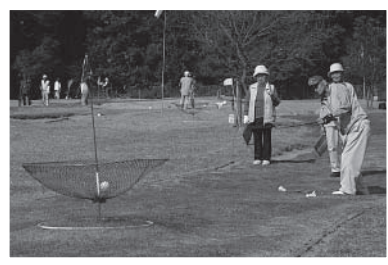
■ターゲットバードゴルフ場