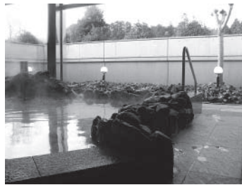
■ふれあい浴室 露天風呂・サウナ・ジャグジー・寝湯・打たせ湯があり日替わりで和風・洋風の雰囲気を楽しめます。