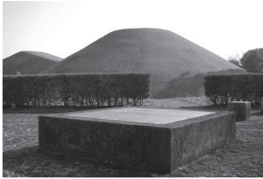
▲富士見塚古墳公園

今回は、霞ヶ浦沿岸の古墳を中心に見学しますので、お誘いあわせのうえ、参加ください。