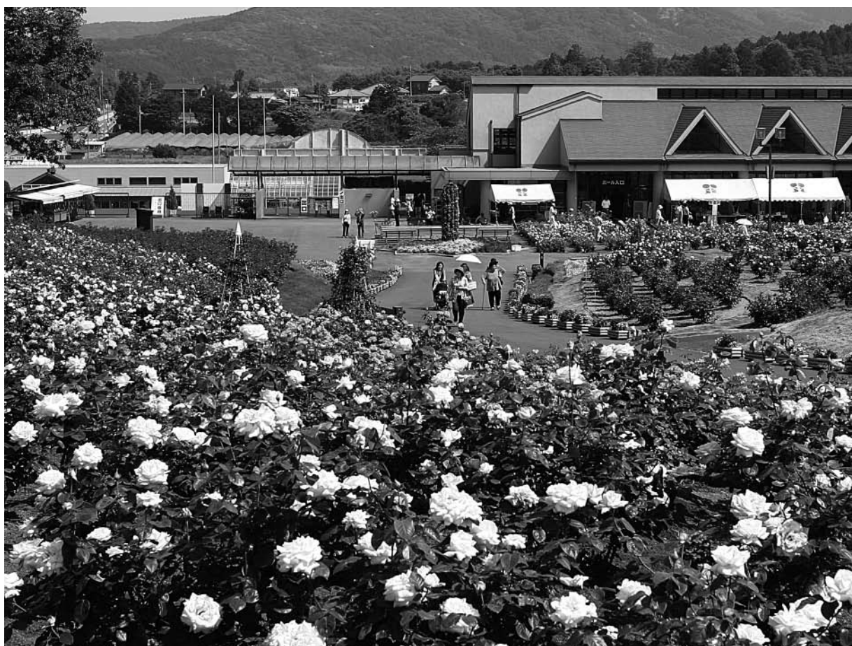
▲県フラワーパーク (本年5月撮影)