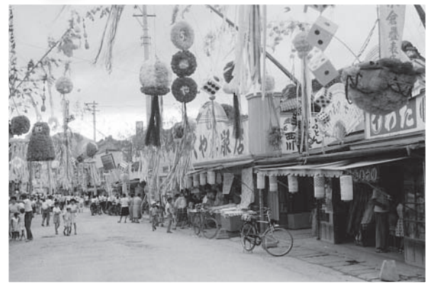
柿岡商店街の七夕まつり (昭和34年)