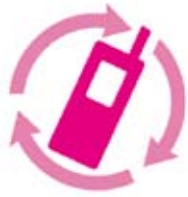
モバイル・リサイクル・ネットワーク 携帯電話・PHSのリサイクルにご協力を。

使わなくなった携帯電話やPHSを「ごみ」として捨てるのは、もったいないことです。これら電話機本体や電池、充電器には、金や銀など『希少金属』と呼ばれるたくさん資源が含まれています。