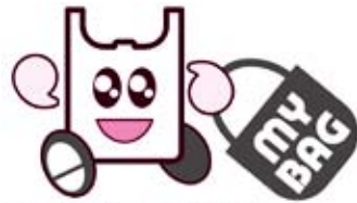
レジ袋を削減する運動

スーパーやコンビニで当たり前のようにもらうレジ袋。その削減は、ゴミを減らすだけでなく、原料となる石油の節約にもつながります。