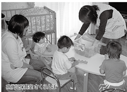
病後児保育室さくらんぼ