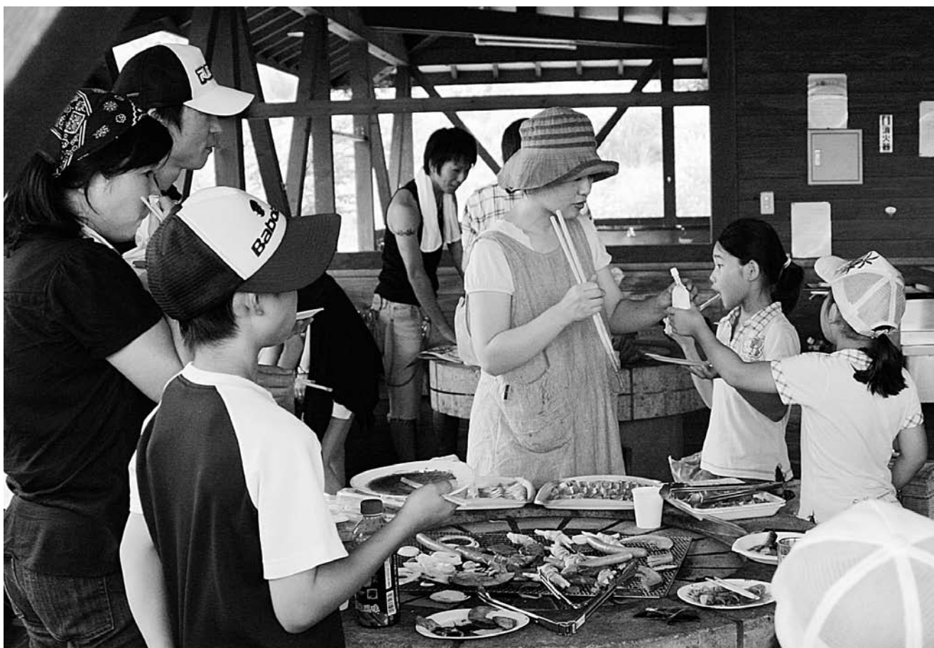
▲つくばねオートキャンプ場にて