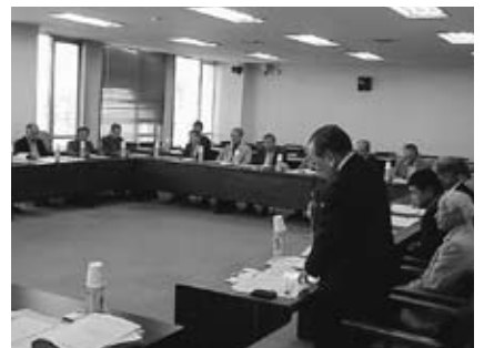
▲熱心な質問に答える連合会役員