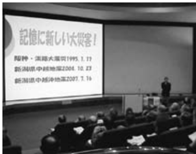
▲防災・地域活動の事例発表

特に、地域防災に対しては、住民自らが「地域防災を考える会」を結成するなど、先進的な活動をしていました。