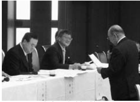
▲知事との懇談会の様子

「現在、月岡真壁線、朝日峠トンネルの整備が進められています。これらの整備により、八郷地区とつくば市を結ぶ、便利な道路状況になります。また、現在八郷地区は茅葺き民家等で注目されている地区で