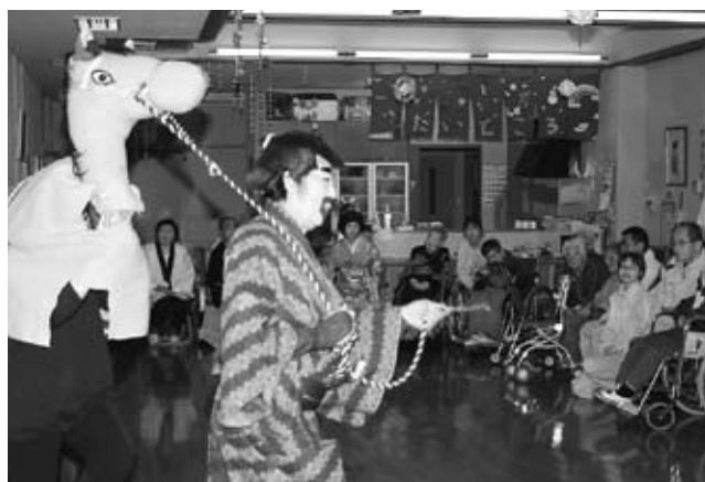
▲「見る人を楽しませたい」と時には、こんな出し物も披露します

また、踊りの先生も「会員の思いや人柄に惹かれて」と、踊りを教えてくれたり、施設訪問に同行して踊りの補佐をしてくれたり、実際に披露してくれたりと協力をしてくれています。