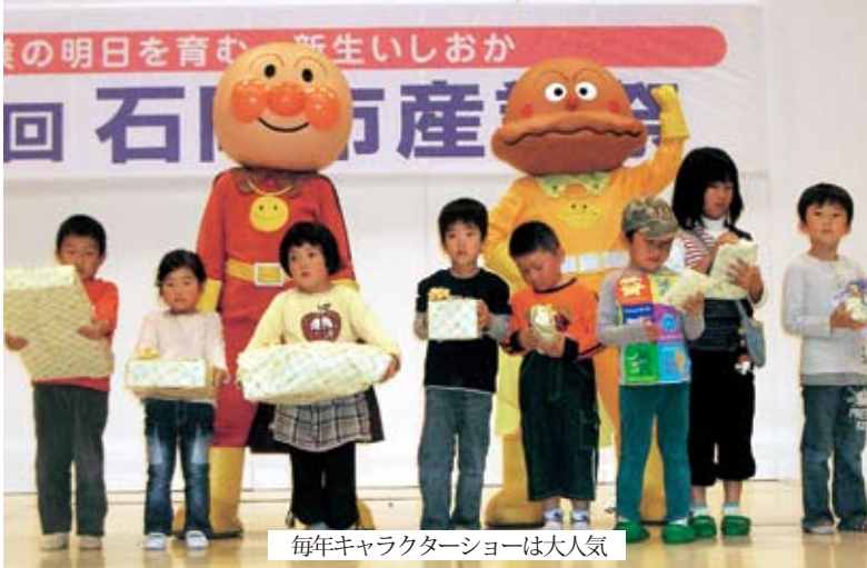
毎年キャラクターショーは大人気