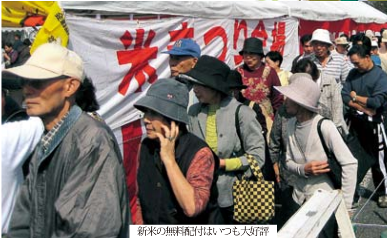
新米の無料配付はいつも大好評