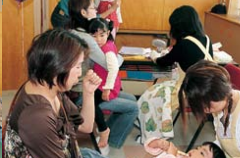
むし歯予防には大切な歯みがき講習