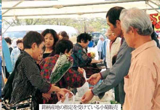
銘産地の指定を受けている小菊販売