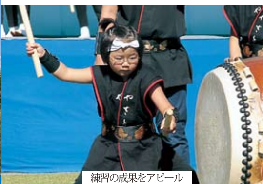
練習の成果をアピール