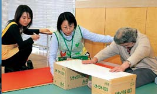
簡単な体前屈測定方法ですね