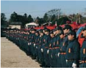
▲昨年の出初式の様子