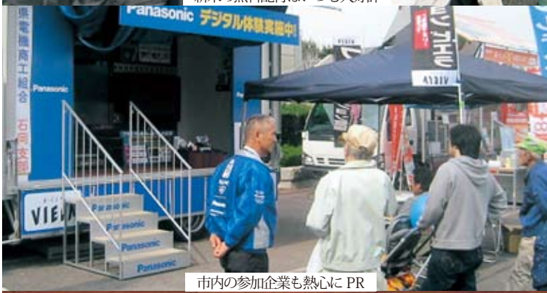
市内の参加企業も熱心にPR