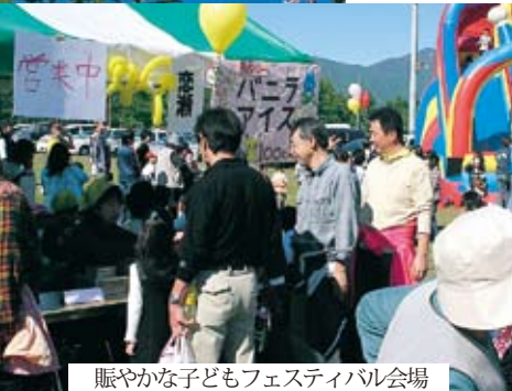
賑やかな子どもフェスティバル会場