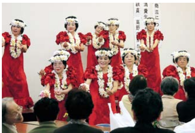
▲ひとり暮らし老人の集いでは、観客も一緒に歌ったり体を動かしたり

訪問先では「花のレイや髪飾りなどを身につけて、色鮮やかな揃いの衣装で踊るのを見ると気持ちがパツと明るくなる」と喜ばれています。フラダンスはあまり見る機会が少ないのか、上手に踊れないにもかかわらず、新鮮だと言って喜んでくれるんです。見ている人たちもいっしょに