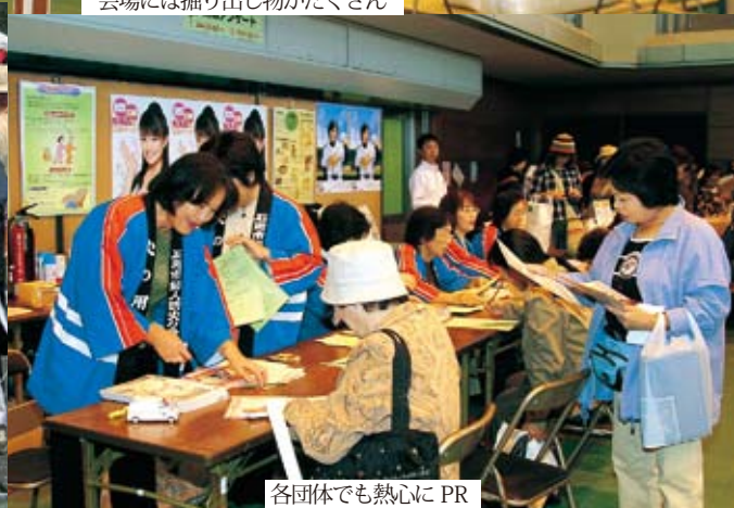
各団体でも熱心にPR