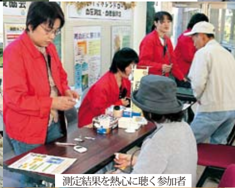
測定結果を熱心に聴く参加者