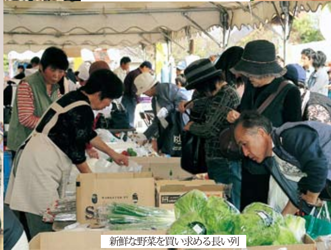
新鮮な野菜を買い求める長い列