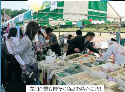
参加企業も自慢の商品を熱心にPR