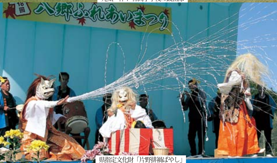
県指定文化財「片野排禍ばやし」