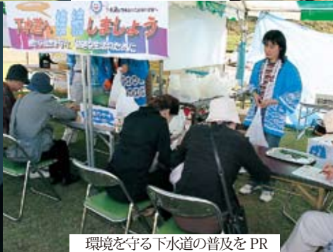
環境を守る下水道の普及をPR