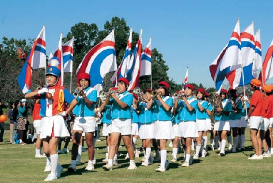
元気一杯！ 柿岡小学校の鼓笛隊

業・商工業などの事業所等が一堂に会しての開催となり、新鮮な野菜の直売や新米の無料配付、特売品の販売などを行っているテントはいつまでも人の列がとぎれませんでした。 10月21日に行われた八郷ふれあいまつりには、40ものテントが並び、地域の特産品紹介コーナーやよしし鍋コーナーに一日中長い行列ができていました。また、特設ステージでは地元伝統芸能をはじめ、吹奏楽や笹みどりの歌謡ショーが行われ、ステージ前の大勢の観客を魅了しました。