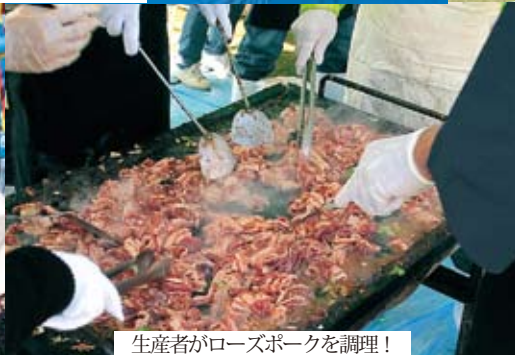
生産者がローズポークを調理！