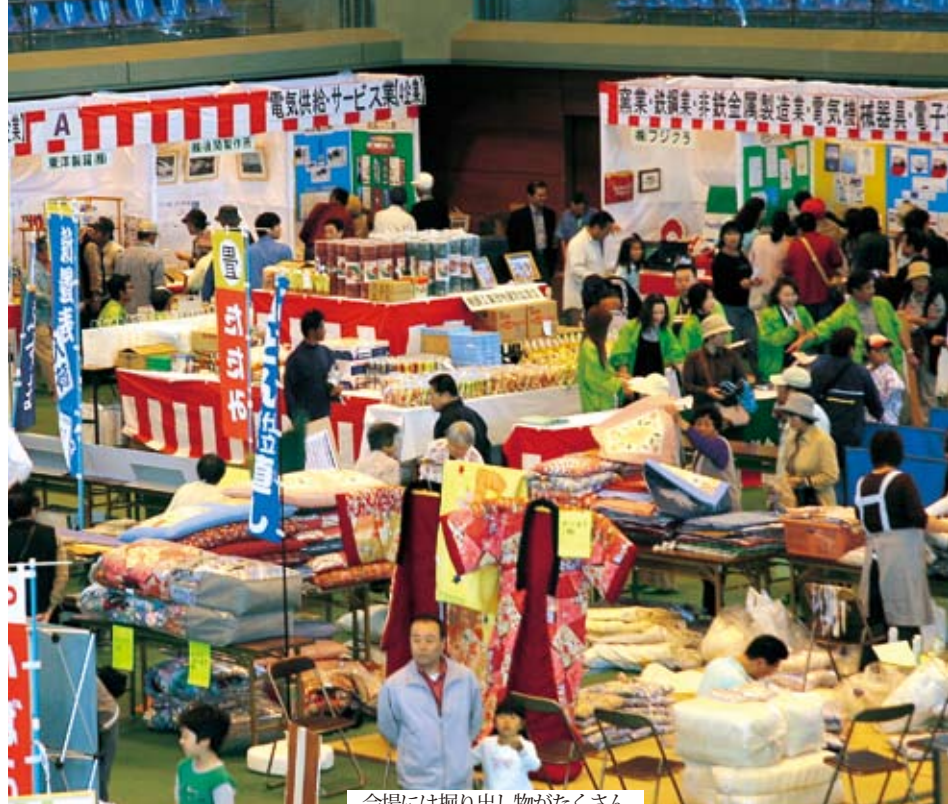
会場には掘り出し物がたくさん

収穫の秋を迎えた石岡市では、恒例イベントの石岡市産業祭、八郷ふれあいまつりが開催され、新鮮な地元の農産物や工業製品の展示・販売、歌謡ショーなどが行われました。 会場となった石岡市運動公園と八郷総合運動公園にはたくさんの方々が訪れ、青空のもと、楽しいひとときを過ごし、実りの秋を満喫しました。 10月13、14日の2日間にわたり行われた産業祭では、米まつりと消費生活展も同時に開催されました。市内の農