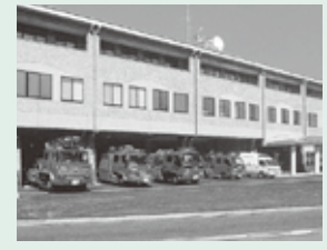
石岡市消防本部 石岡消防署

(旧) 石岡市石岡 3165 番地 2 ↓ (新) 石岡市石岡一丁目 1 番地 1