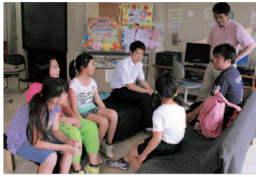
▲今年はどんな仕掛けにしようかと、放課後の作戦会議