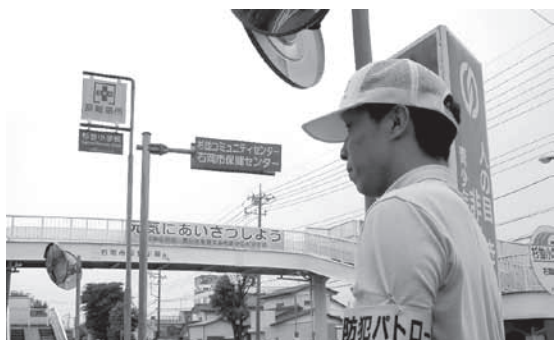
▲地域を見守るエンゼル・パトロール

エンゼル・パトロールは、散歩やウォーキングなどをしながら地域のパトロールをするもので、子どもの下校時間帯や薄暗くなってきた夕方時間帯には犯罪に対する大きな抑止効果があります。