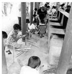
▲昨年の幹部講習会

事前に生涯学習課で仮予約をし、使用希望日の1週間前までに使用許可申請書(生涯学習課と市民課に備えてあります)に必要事項を記入し、キャンプ場使用料をお支払いください。使用許可証はその場でお渡しします。 ※仮予約は正式な予約ではありませんのでご注意ください。