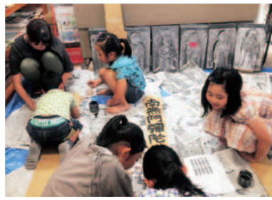
▲ボールや新聞紙、発砲スチロールなど、身近にある材料を使ってお化け屋敷を作っていきます