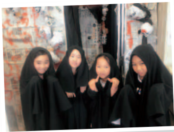
▲作るだけでなく、実際にお化けになってお客さんを驚かせます