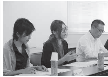
▲総合戦略を検討するため、昨年5月から「ふるさと再生会議」を4回開催。委員は各種団体の代表のほか、公募で選ばれた3人の市民など計20人で構成。