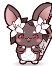
たしなうさぎモモア

* 「広報いしおか」は、最寄りの公共施設、金融機関、市内コンビニエンスストア、石岡駅、高浜駅に置いてあります。