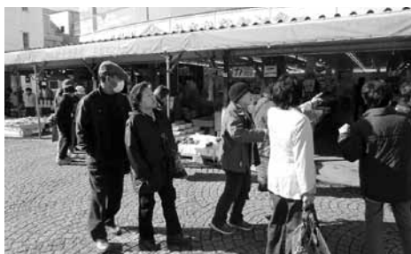
▲第3回いきいき活動事業。那珂湊お魚市場にて

▶高齢者の閉じこもり解消のために、外出するきっかけをつくることで心身の機能低下を防ぎ、閉じこもりの抑制を図ります。