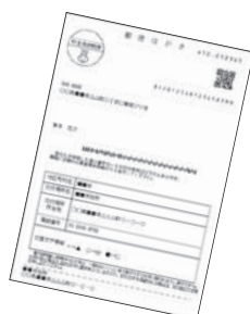
▲交付通知書 (ハガキ)

▼交付通知のハガキが届いた人は、記載された予約連絡先で受け取りの予約をお願いします。