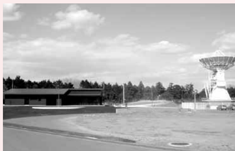
▲観測局舎(左)とパラボラアンテナ(右)

一般公開では、施設内の案内と、パラボラアンテナに登ったり、測量機器を実際に操作したりするなど、普段体験できないイベントを多数用意しています。ぜひお出でください。入場は無料。