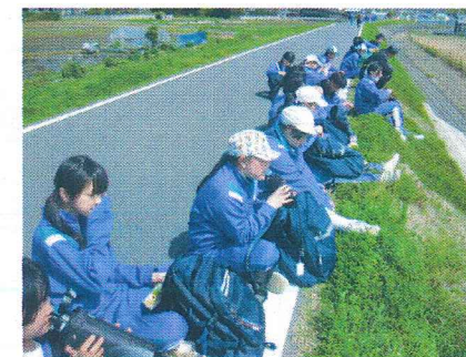
マナーを守り、感謝の心と思いやりのある生徒