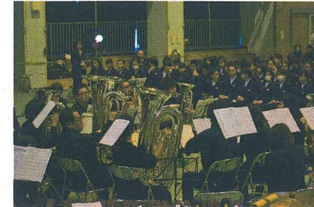
夢や目標を達成するため、自助努力する生徒

校名の由来 常陸府中松平家の陣屋から南方に位置するため城南中と名付ける。 校章の由来 三中学校の統合と松平家の家紋三葉葵を結びつけた。