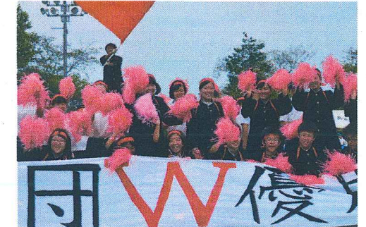
明るく、たくましい生徒