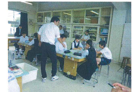
創造性に富み、自ら学ぶ生徒