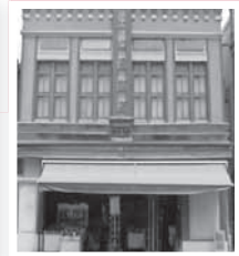
▲中心市街地地域の看板建築