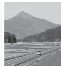
▲筑波山を中心とした里山景観

中心市街地や里山の景観を守るために、地域の特色を生かした事業を行う事業者に、基金を財源とし、助成を行う制度です。