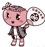
▲マスコットキャラクター

の申告をしていない人は、早めに申告してください。 ※1月2日以降に転入した人は、1月1日現在に住所のあった市町村の課税証明書（所得金額、扶養人数の記載のあるもの）または、非課税証明書を持参してください。 ■問い合わせ 1 保険年金課（内線133） 2 市民窓口課（内線1126）