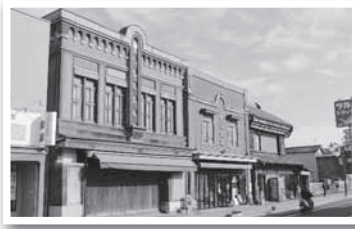
▲中心市街地地域の主要道路沿道の建築物など