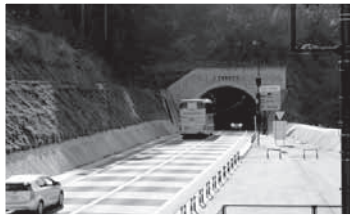
▲朝日地区の主要道路沿道の建築物など