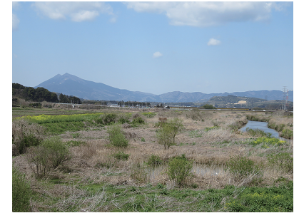
国道六号にかかる恋瀬橋から東雄がふるさとを思い眺めたと思われる恋瀬川と筑波山の風景