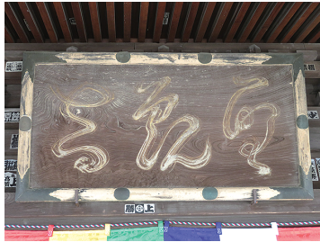
善応寺観音堂にかかげられてある「聖観音」の扁額

そのような影響もあってか、国学者としての東雄は、水戸藩をはじめ全国の尊攘派志士との交流も深まり、特に藤田東湖の門弟・櫻任蔵などはしばしば善応寺を訪れ、寝食を共にしたという。藤田からは水戸藩への出仕も勧められたが、「我既に主あり、二心あるべからず」とこれに応じなかった。