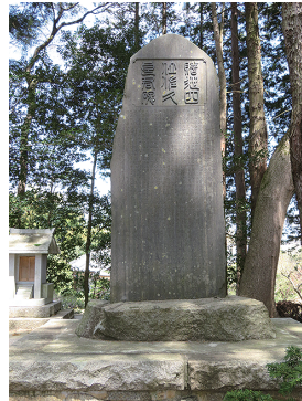
東雄神社境内の従四位記念碑

※参考・引用「八郷町史（平成17年3月25日 八郷町史編さん委員会）」、「佐久良東雄（昭和57年3月25日 八郷町教育委員会）」、「佐久良東雄伝（明治27年3月26日 佐久良巖）ほか