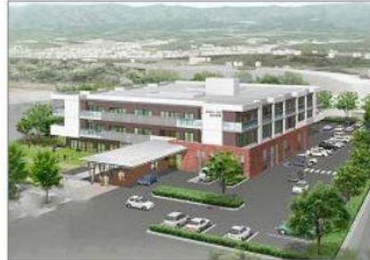
【地域包括ケアセンター（イメージ）】