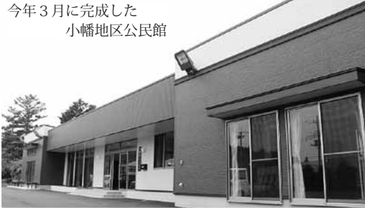
今年3月に完成した 小幡地区公民館