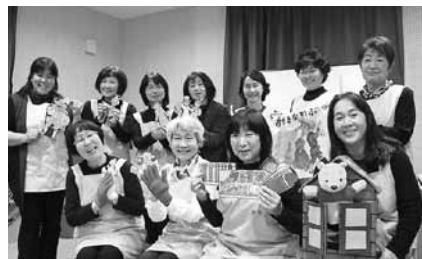
▲読み聞かせボランティアの皆さん。季節にあわせて絵本を選び、手遊びなども取り入れたおはなし会です。

※申し込みは不要です。すべて30分程度で、赤ちゃん連れでも大丈夫です。安心してお越しください。