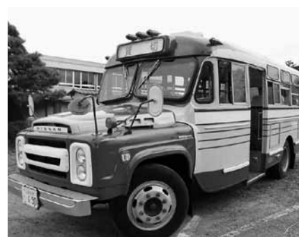
▲当日はレトロなバスが区内を走りました

この日は、結婚して有明地区を離れた卒業生もイベントを手伝いに有明中に集まります。石岡市ふるさと大使で同中卒業生でもある歌手の高田梢枝さん（日々かりめろ）も登場。イベントのフィナーレは、地元の人々の温かいメッセージとともに、地元の人々の手によって打ち上げられた花火70発。有明地区の夜空に、大輪の花が咲き、会場には歓声と拍手が響きました。