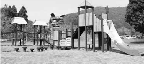
昨年 11 月 1 日にリニューアルした 常陸風土記の丘ふれあい広場の大型遊具