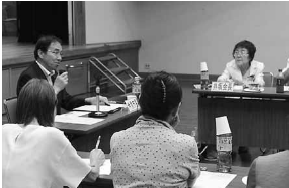
▲ボランティア連絡協議会とのタウンミーティングの様子

市長自らが地域や団体の皆さんのもとに出向き、より良いまちづくりのためにお話をうかがう制度です。