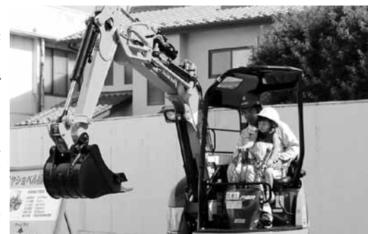
▲石岡 J C が担当したキッズワークエリア

を盛り上げたほか、石岡二高の生徒はスタンプラリー企画を、商業生は開発した商品販売などを行いました。