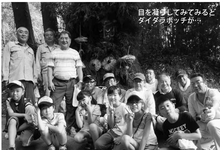
目を凝らして見てみると ダイダラボッチが...