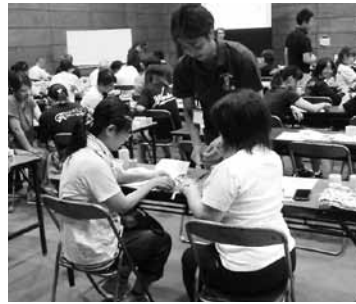
▲参加者同士でテーピングを施します

7月21日、石岡運動公園体育館でケガの応急処置と予防のためのテーピング講習会が開催されました。地域のスポーツ指導者49人が講義を受け、関節のテーピングの実習を行いました。