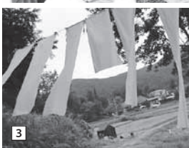
1 八郷の竹で作られた巨大アスレチック。すべり台、ブランコ、ハンモックに胸が躍ります 2 後方から時計回りに地域おこし協力隊の大重さん、阿瀬さん、久野さん、木崎文子さん、井上さん 3 風になびくのれん。緑深い棚田の中に突如現れる真っ白なのれんが、来場者を出迎えます