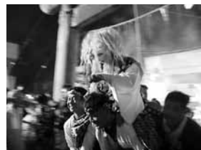
▲きつねが八坂神社の鳥居をくぐり拜殿の中で舞を披露します