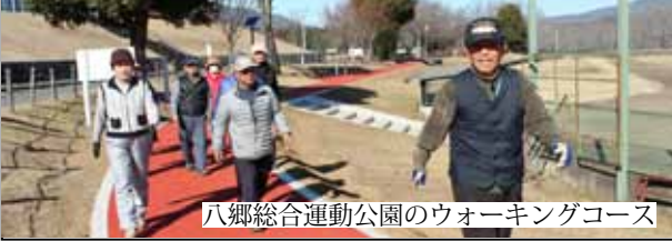
八郷総合運動公園のウォーキングコース