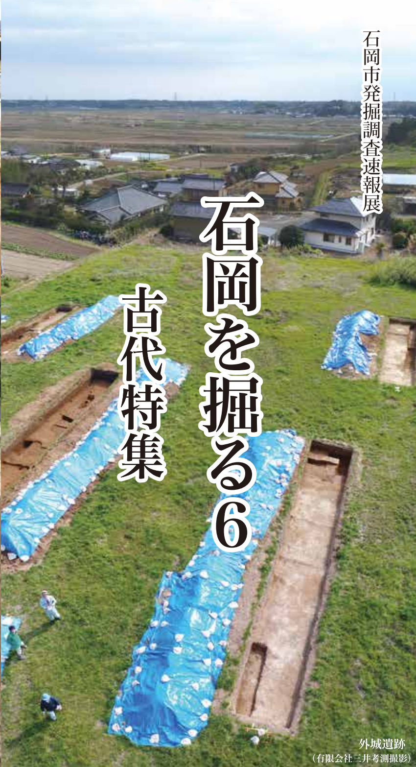
外城遺跡