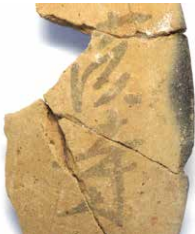
茨城廃寺跡 墨書土器「茨寺」