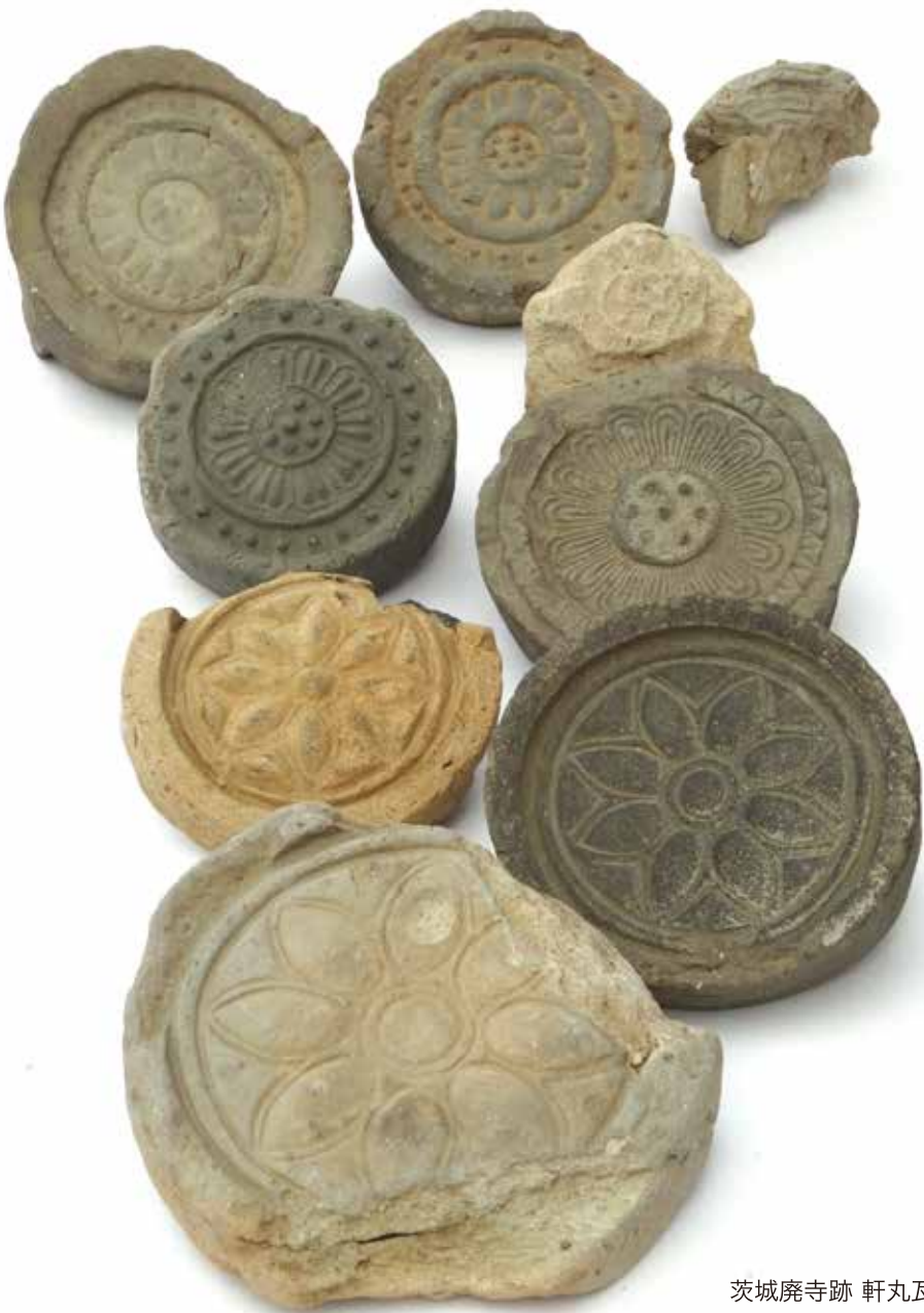
茨城廃寺跡 軒丸瓦