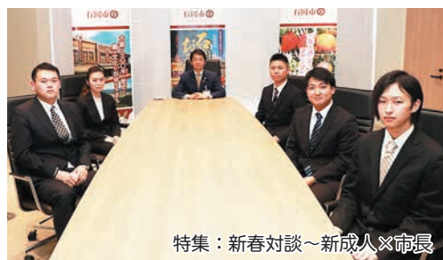
特集：新春対談～新成人×市長

取り上げてほしい内容や企画がありましたら「読者アンケート」までご意見お待ちしております。 詳しくは裏表紙をご覧ください。