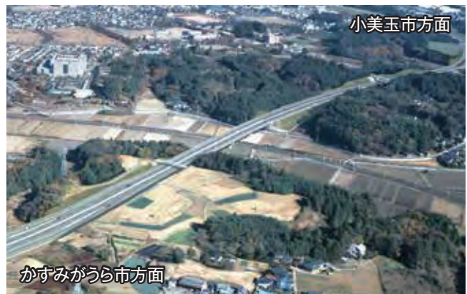
▲石岡市東田中付近