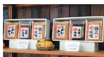
▲茨城県産の米と国産の大豆と塩を使用した、3種類のみそ詰め合わせセットもおすすめ。みそや糀などの商品は、ネットショップ「BASE」からも購入できます▶