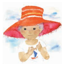
▲赤い帽子の男の子 1971年 ちひろ美術館蔵