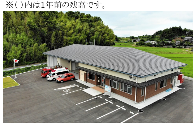
今年3月に完成した愛郷橋出張所