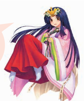
市マスコットキャラクター いしおか恋瀬姫