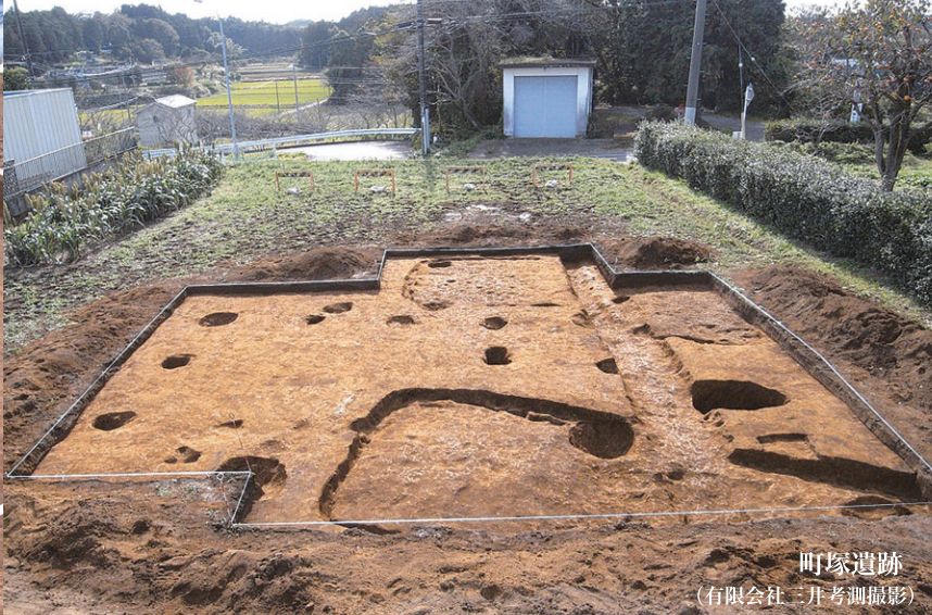
町家遺跡