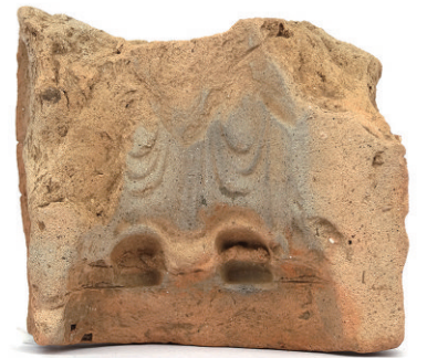
▲東成井山ノ神遺跡 仏像鑄型

今 回の企画展では、これまで「石岡を掘る」で紹介してきた遺跡に新たな遺跡を加えたうえで、時代別に再構成。石岡市の最新の発掘調査成果を「総まくり」します。