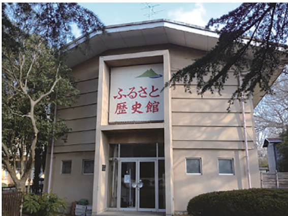
石岡市立ふるさと歴史館

開館時間 午前10時～午後4時30分 休館日 毎週月曜日（祝日の場合は翌日） 交通 JR常磐線石岡駅西口より徒歩約12分 駐車場あり 住所 石岡市総社1-2-10 石岡小学校敷地内 電話 0299-23-2398