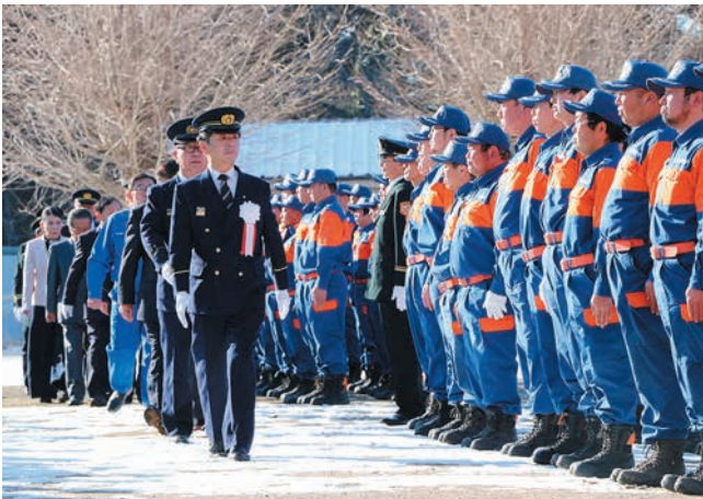
▲石岡小の校庭で行われた人員服装点検。緊張感漂う中、市長などが、消防職員75人と消防団員150人を、観閲しました。