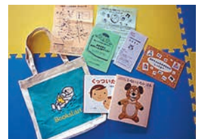
▲スタートパックの内容

また、郷の本棚やさと図書館、こども図書館本の森では、0歳から楽しめる、おすすめ本をご用意しています。この機会に、ぜひお子さんと一緒に図書館へお越しください。