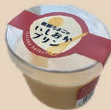
新鮮たまごの石岡プリン

厳選した石岡市産の新鮮な卵と茨城県産の牛乳をたっぷり使用したプリン。食べた瞬間に感じる卵の濃厚さとどこか懐かしい固めの食感が特徴です。