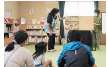
▲おはなし会の様子 (本の森)

育児本も同スペースに備えてあるので、保護者の皆さんも、お子さんと一緒に読書を楽しむことができます。毎月第2土曜日にはおはなし会も開催予定。