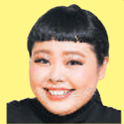
大神輿や山車などが繰り出す石岡のおまつり

1987年10月23日、茨城県石岡市生まれ。血液型A型。学生時代からお笑い芸人に憧れ、NSC東京校に12期生として入学。2008年にピョンセダンスでブレイクし、現在ではバラエティ番組には欠かせない存在。よしもとクリエイティブ・エージェンシー所属。平成24年に初代・石岡市観光大使に就任、現在では初代・石岡市観光特使として活躍中。