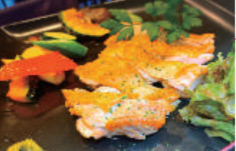
「旬菜 ichiba 陣屋門」のつくば鶏の塩焼き1408円