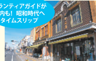
JR石岡駅からレトロな街並み散歩へ出発