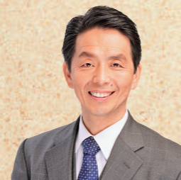
石岡市長 谷島洋司

石岡市は奈良・平安の昔からこの地域の中心であり、万葉集にも歌われた筑波山や恋瀬川、霞ヶ浦などがあるロマン駆り立てられるまちです。東京圏からも1時間。ここには美味しいお酒、季節の果物、毎日違う里山の景色、人を癒やすすべてがあります。ぜひ魅力あふれる石岡市へお越しください。