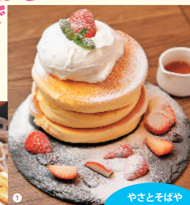
やさどそばやしし鍋からスイーツまで