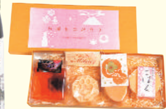
フルーツなどを使用した石鹸も開発

老舗酒蔵が多い街ならではの、みやげの一番人気は日本酒。このほか野菜やフルーツの加工品なども人気が高い。長い歴史を誇る伝統の技を今に引き継ぐ工芸品なども忘れずに。