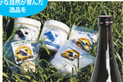
美しい自然が生んだ乳製品も見逃せない