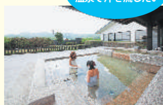
眺望が自慢のやさど温泉ゆりの郷