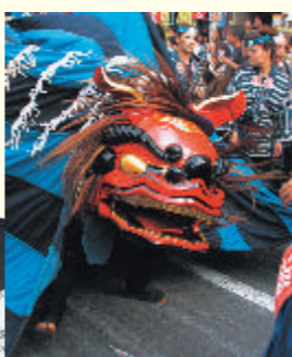
獅子頭は石岡のおまつりの主役的存在