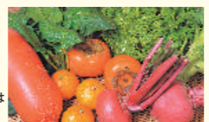
農産物直売所には朝どれ野菜が並ぶ

石岡を旅する人にとっての最大の魅力は、旬の味覚を味わうこと。市内に点在する農産物直売所で、みやげを揃えることもできる。さらにフルーツ王国である石岡では1年中がフルーツ狩りのオンシーズン。