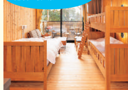
花やさと山のサークルロッジ