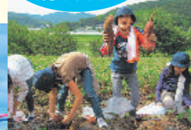
農業体験は忘れられない思い出になる