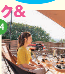
花やさと山のグランピングエリア