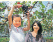
1年を通してフルーツ狩りが楽しめるぞ

石岡を旅する人にとっての最大の魅力は、旬の味覚を味わうこと。市内に点在する農産物直売所で、みやげを揃えることもできる。さらにフルーツ王国である石岡では1年中がフルーツ狩りのオンシーズン。