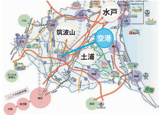
▲県総合計画に位置づけた4方面案