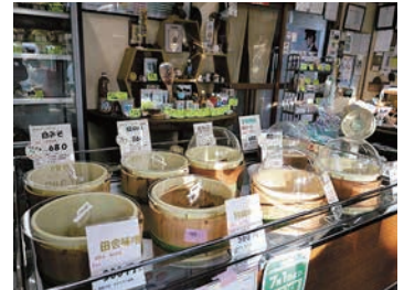
▲店内は自家製味噌や糍を使った商品が陳列。