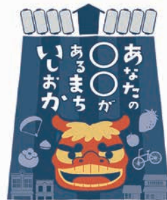
▲石岡市シティプロモーション ロゴマーク